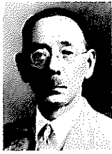
帝人創業者 久村 清太氏 (1880-1951)